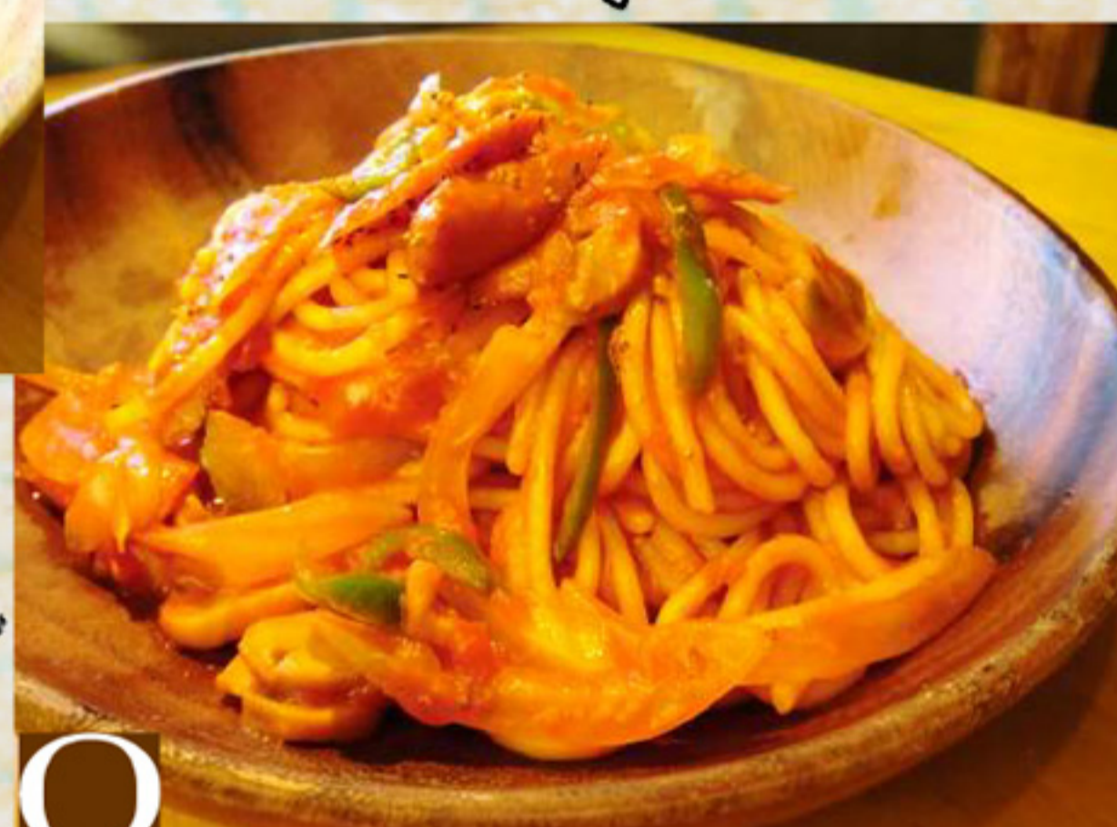
O ナポリタン ¥890 (税込 ¥961)