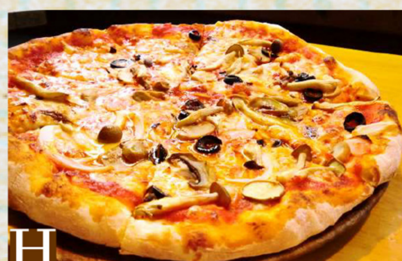
H アンチョビ・キノコのガーリック