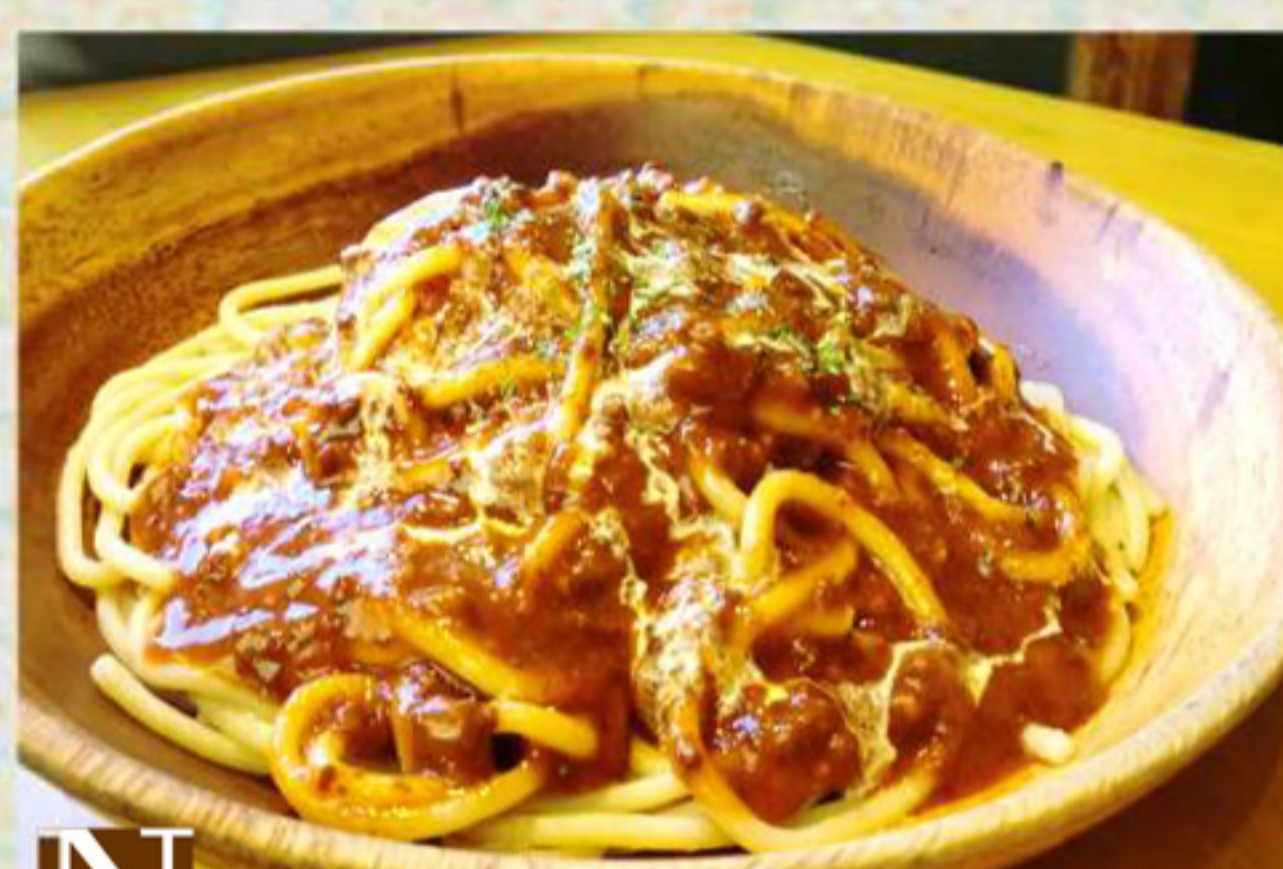
N ミートソース ¥890 (税込 ¥961)