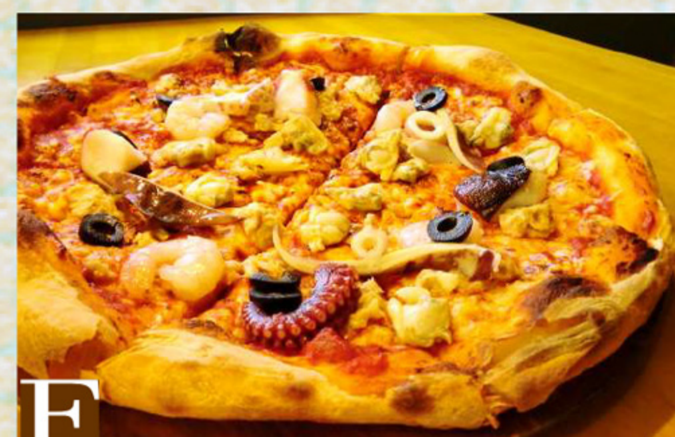
F シーフードミックス