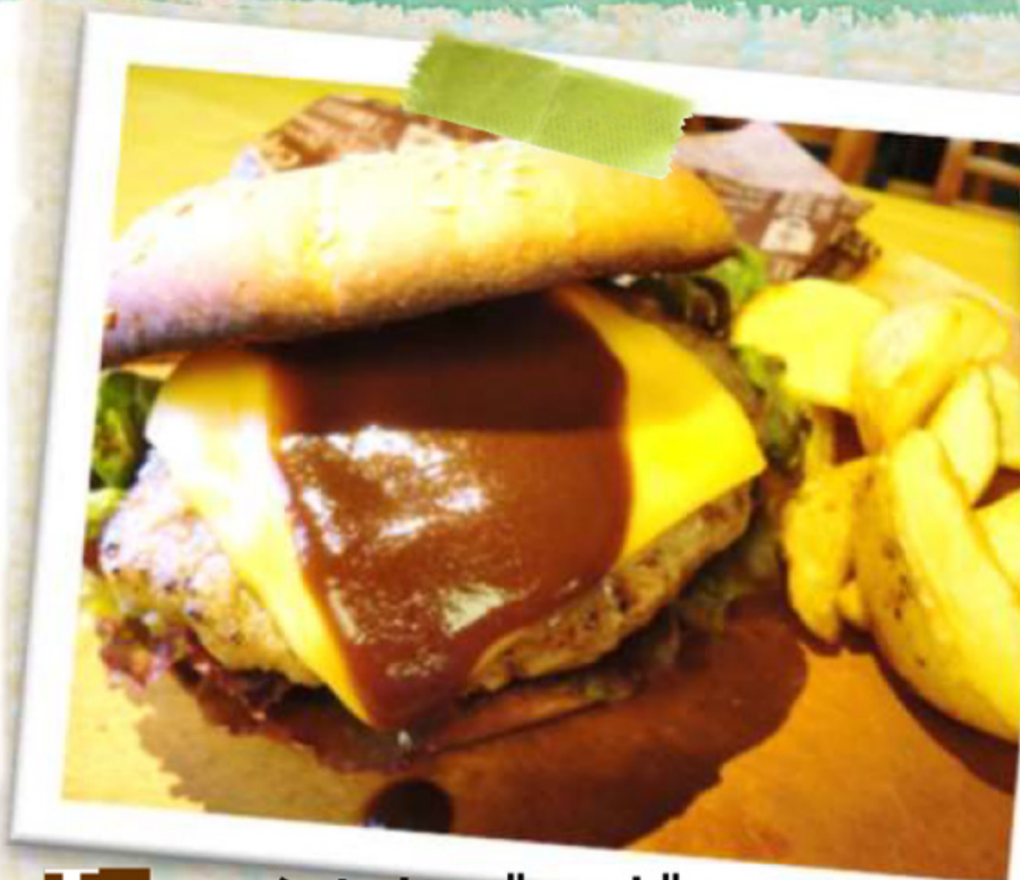
W ワイルドバーガー