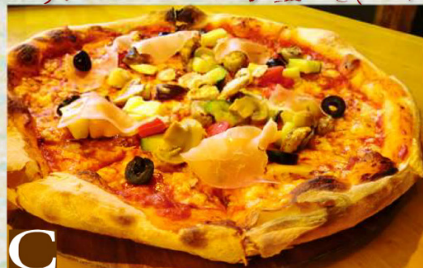
C イタリア野菜と生ハム