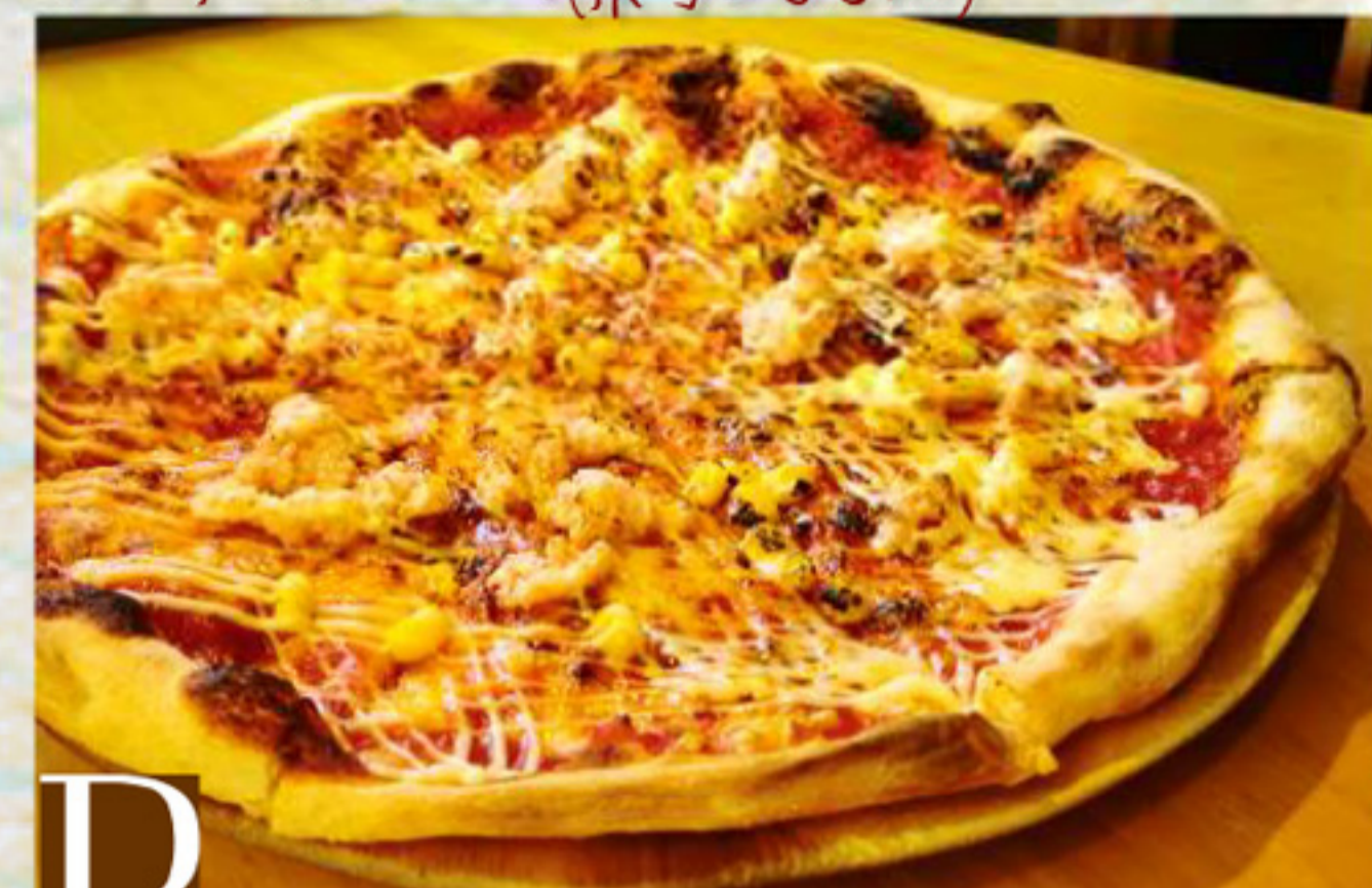
D ズワイガニとコーンの焼きマヨ