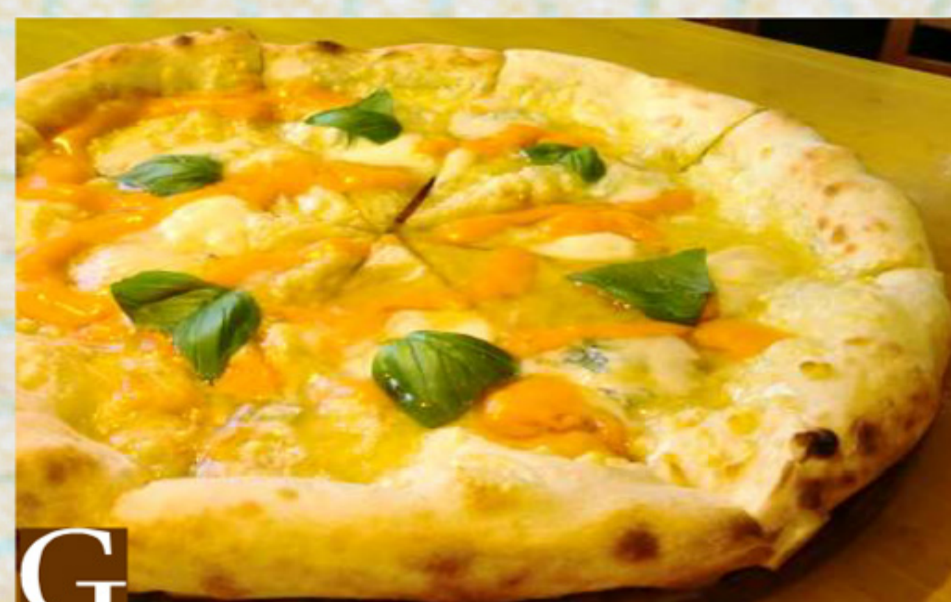
G クワトロフォルマッジヨはちみつづけ