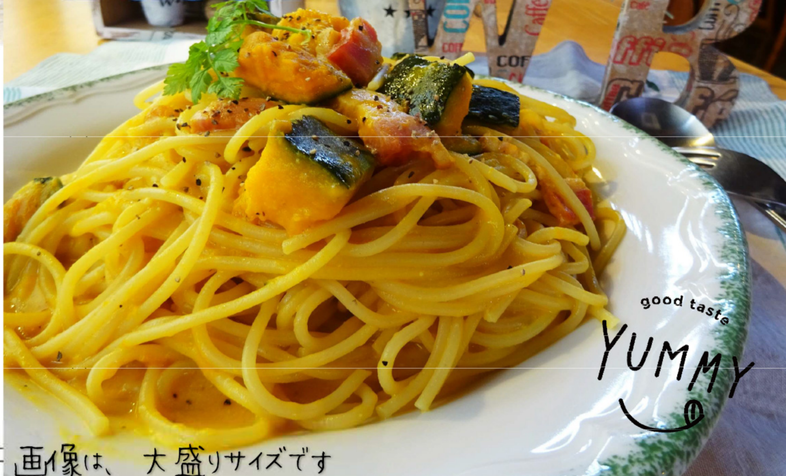
画像は、大盛りサイズです